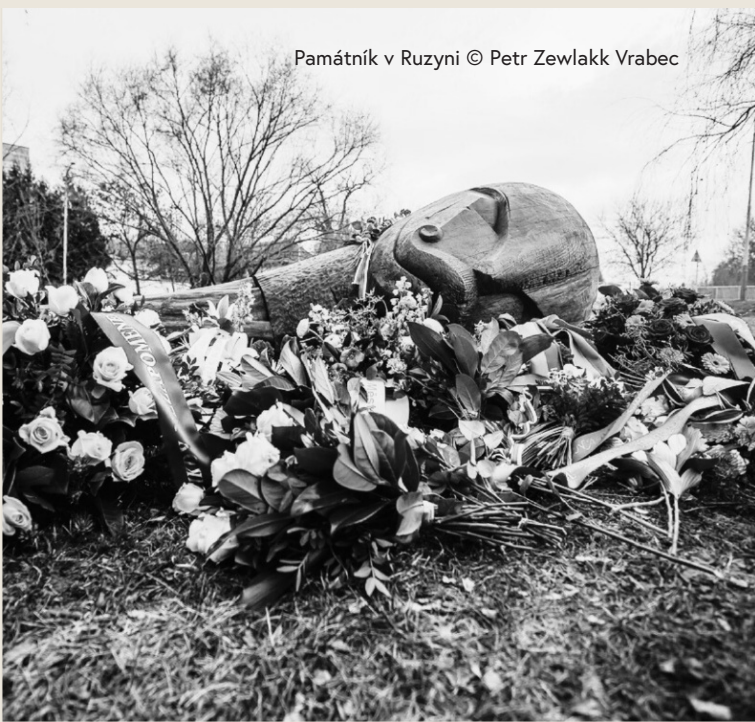
Památník v Ruzyni

Pražské centrum pro romské dějiny, Filozofická fakulta Univerzity Karlovy v Praze Muzeum romské kultury, státní příspěvková organizace